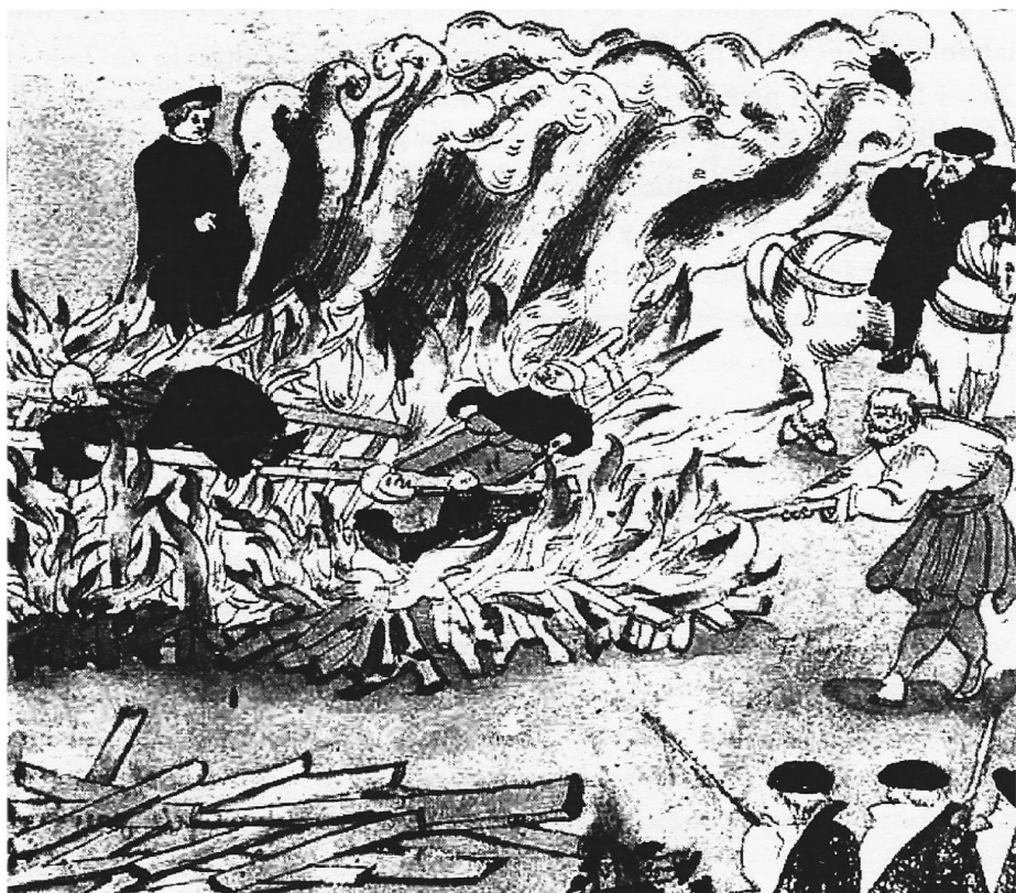
Streghe bruciate al rogo in Svizzera. Illustrazione di Johann Jakob Wick (1585).

lavoro, e arrangiandosi in un'alternanza caotica di lavoro salariato, di elemosina e di una buona dose di crimine. Questi 'vagabondi' furono duramente perseguiti da diverse leggi, che includevano una varietà di punizioni tra cui la fustigazione pubblica e la carcerazione. Si produsse un processo di criminalizzazione della persona povera, che era stata creata dai cambiamenti sociali. Tra questi vagabondi e queste comunità migranti che giravano in lungo e in largo l'Europa c'era una grande percentuale di donne, molte delle quali erano state costrette ad abbandonare le loro terre a causa dei cambiamenti legali che avevano ristretto i diritti delle donne ad ereditare terre o proprietà. Molte di esse si trasferirono nelle città per lavorare in diverse attività artigianali o convertirsi in cameriere, prostitute, ballerine o infermiere.