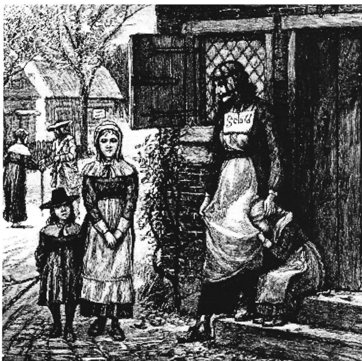
Briglia con cui si punivano le donne ribelli o contestatarie. Illustrazione del secolo XVIII.

di divertimento, di intrattenimento e le celebrazioni che avevano spesso luogo in quelle terre comuni. Le tradizionali feste comunitarie furono rimpiazzate dai rituali della Chiesa, che trasformarono i festival di gruppo, le feste, le danze e le orge in eventi gerarchici, noiosi, tormentati dal senso di colpa e del dovere.