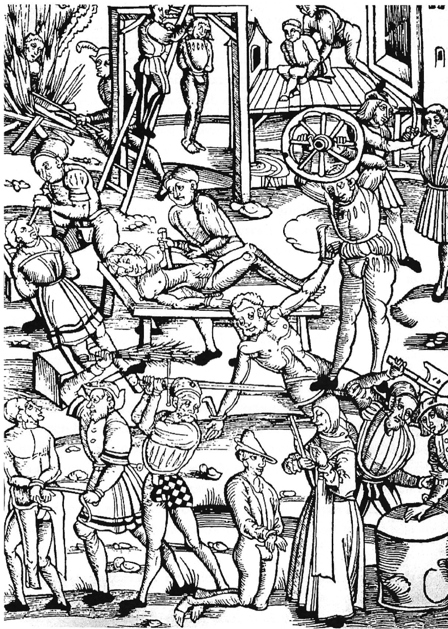
Punizioni per stregoneria nel secolo XVI. Xilografia tedesca del 1508.