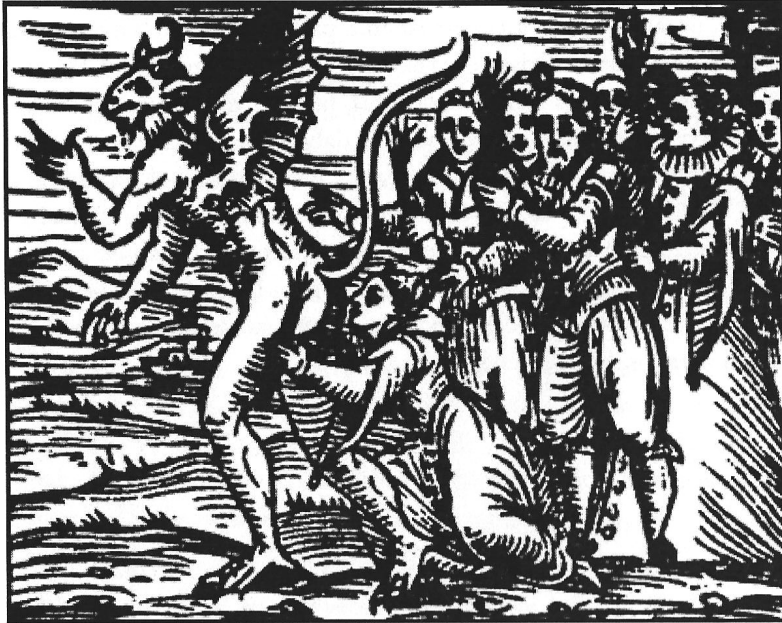
“Il bacio osceno”, illustrazione che rappresenta una strega che bacia l'ano del diavolo.

Inclusa nel libro Compendium Maleficarum di Francesco Maria Guazzo (1608)