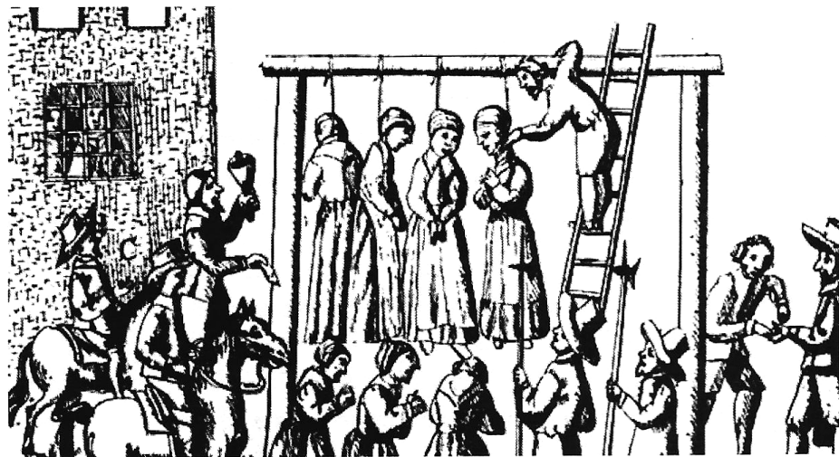
Impiccagione di donne accusate di stregoneria nel processo di Salem (1692).

La caccia alle streghe divenne un affare: i cacciatori di streghe prendevano tangenti per non accusare delle persone, e poi c'erano i salari dei vari boia, cacciatori, funzionari ecc. I documenti che elencano le spese dei processi includono la legna, gli strumenti di tortura e la birra per la squadra che processava la strega. In Irlanda, dove furono uccise alcune donne ricche, accadde che la classe dominante alla fine si innervosì e smise di supportare i processi.